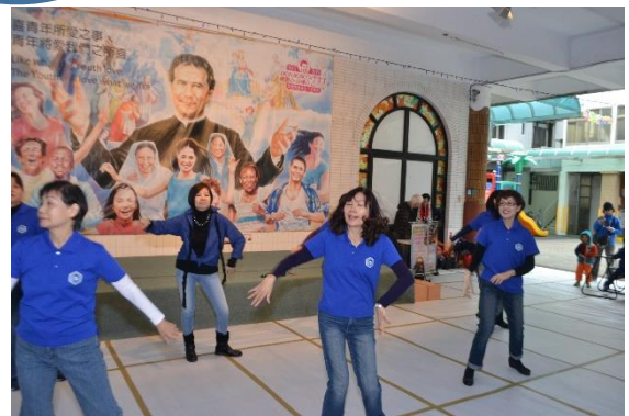
慈幼大家庭日團康表演 小蘋果