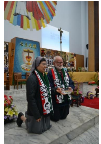
會士與修女謙遜地服務教友