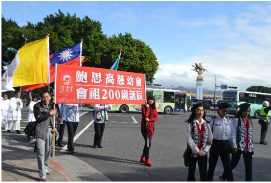
遊行隊伍行經松山機場前