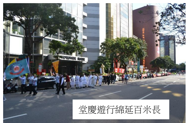
堂慶遊行綿延百米長