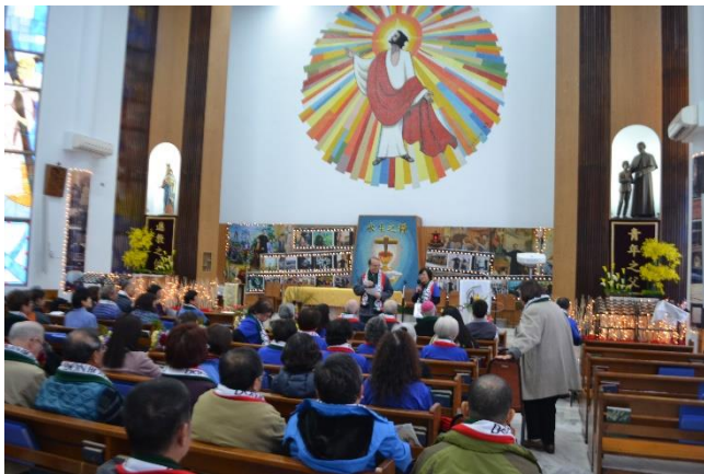
慈幼大家庭日神修研習