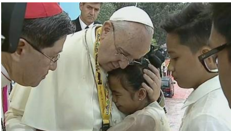
聖方濟各亞西西瞻禮