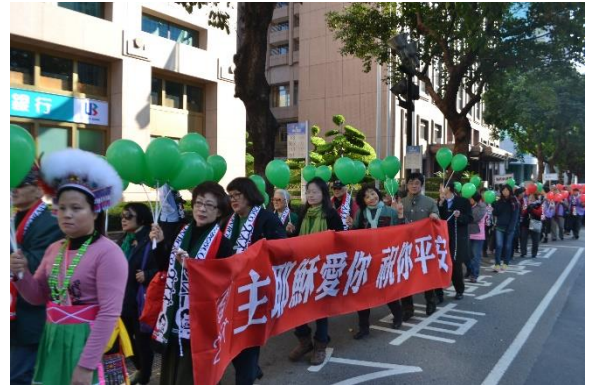
阿美族也來參加遊行