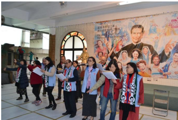
慈幼大家庭日團康表演