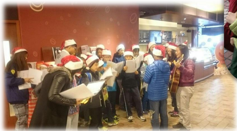
來麥當勞叔叔家 報佳音