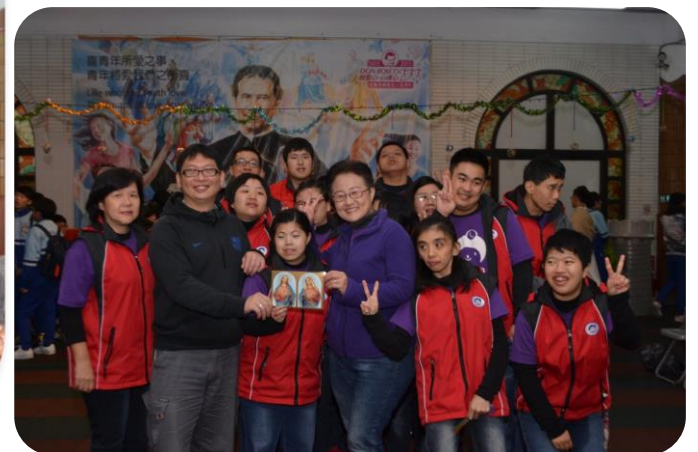
小貝殼工作坊 遲緩青年來訪