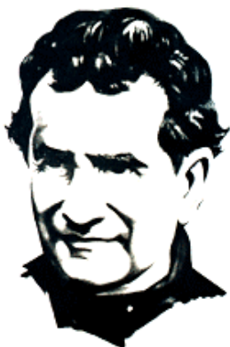
1/31 會祖聖若望鮑思高