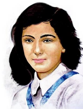
1/22 真福羅蘭·衛冠納 Bl. Laura Vicuna 1875-1923 (見 1401 期思高之聲介紹)