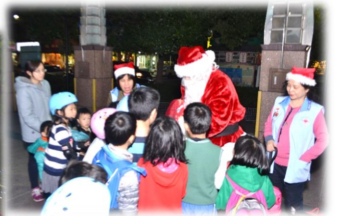
聖誕老公公與粉絲