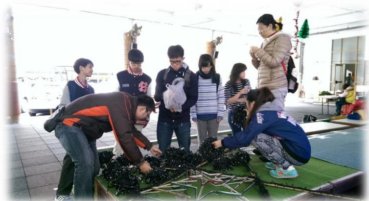
救主星 將為我們誕生了