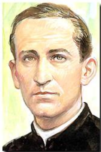
1/15 真福類斯·華里神父 Bl. Louis Variara, —